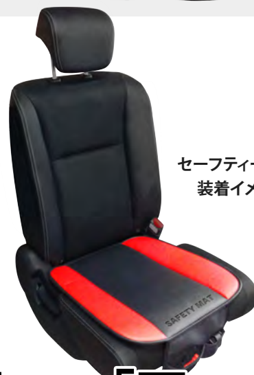
セーフティマット 装着イメージ