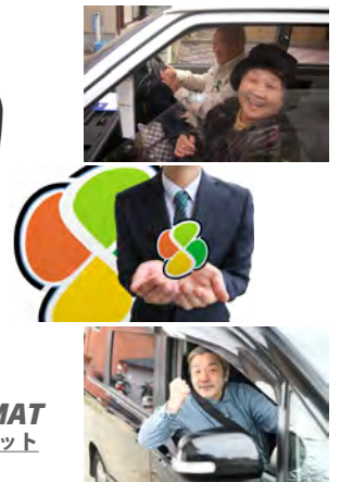
SAFETY MAT セーフティマット

家族の声で、安全運転を支援する。 今すぐにでもできそうな対策から、始めてみましょう。